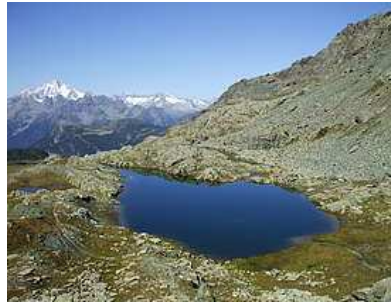
Lagheti di Campagneda