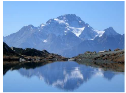
Monte Disgrazia dai Lagheti di Campagneda