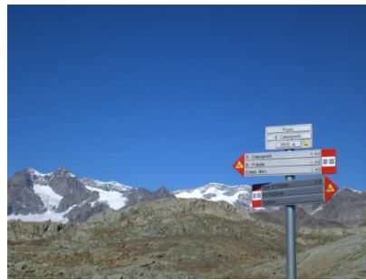
Passo di Campagneda