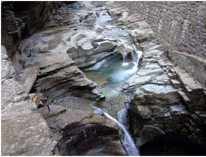
Marmitte dei Giganti (Cavaglia)