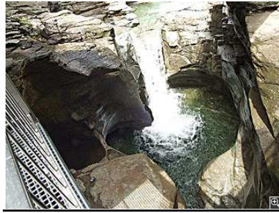
Marmitte dei Giganti (Cavaglia)