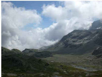
Passo di Canciano