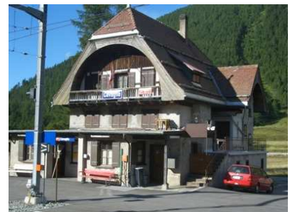
Stazione di Cavaglia