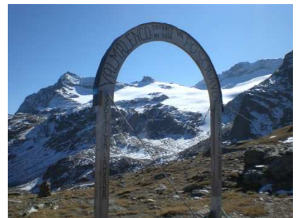
Passo di Campagneda