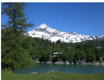
Pizzo Scalino e Rifugio Zoia