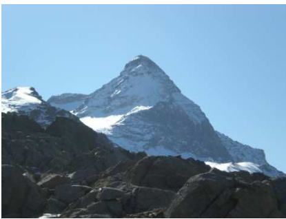
Pizzo Scalino dal Passo di Campagneda